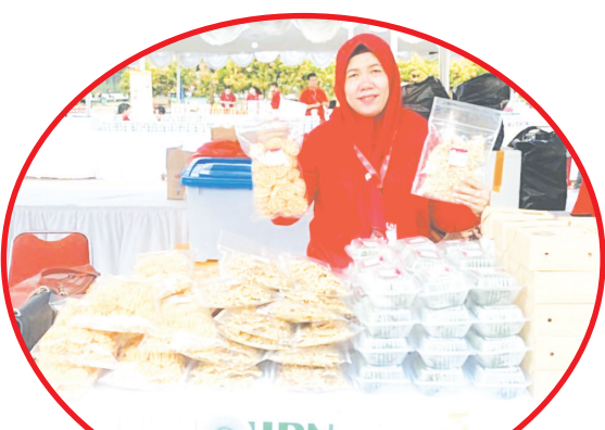
UMKM Peyek Kacang memperlihatkan produknya.