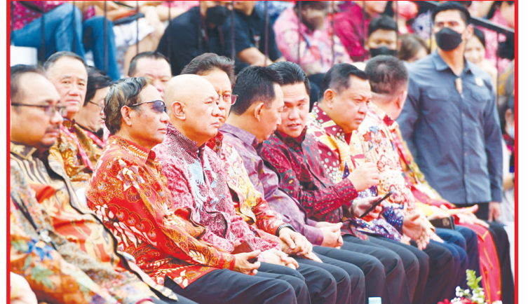
Yaquf Cholil Qoumas, Mahfud MD, Teten Masduki, Budi Gunadi Sadikin, Listyo Sigit Prabowo, Erick Thohir dan undangan lainnya.