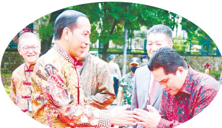
Presiden Joko Widodo berjabat tangan dengan Menteri BUMN Erick Thohir

Peringatan Imlek Nasional 2023 ini diikuti oleh lebih dari 700 UMKM dan mengundang 50.000