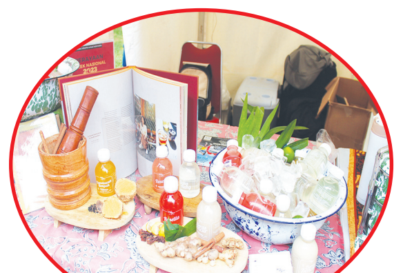
Stand UMKM jamu.