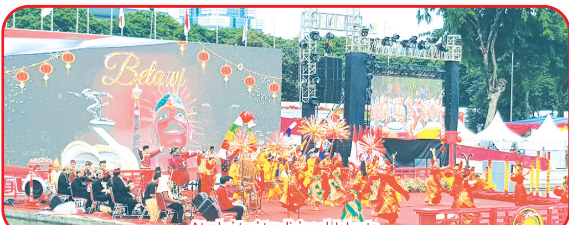
Atraksi tari tradisional Jakarta.