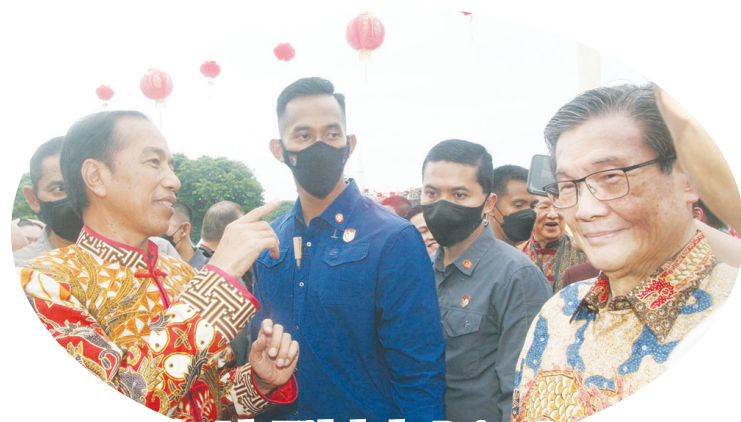
Presiden Joko Widodo dan Prajogo Pangestu berbincang akrab.