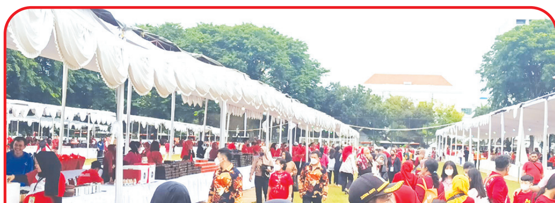
Suasana ramai Stand UMKM.