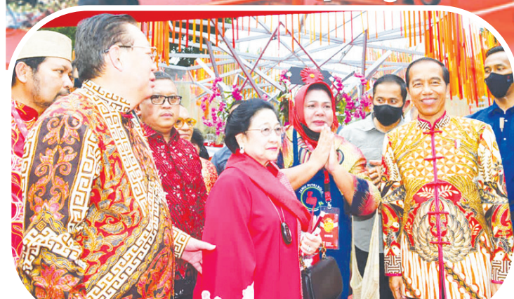
Presiden Joko Widodo dan Megawati Soekarnoputri memasuki lokasi Perayaan Imlek Nasional 2023.