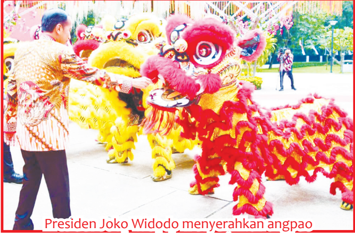
Presiden Joko Widodo menyerahkan angpao kepada barongsai.

700 UMKM Ikut Serta, Ribuan Undangan Berbagai Kalangan, Bersama-sama Nikmati Kuliner Lezat