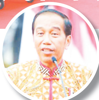
Presiden Joko Widodo.