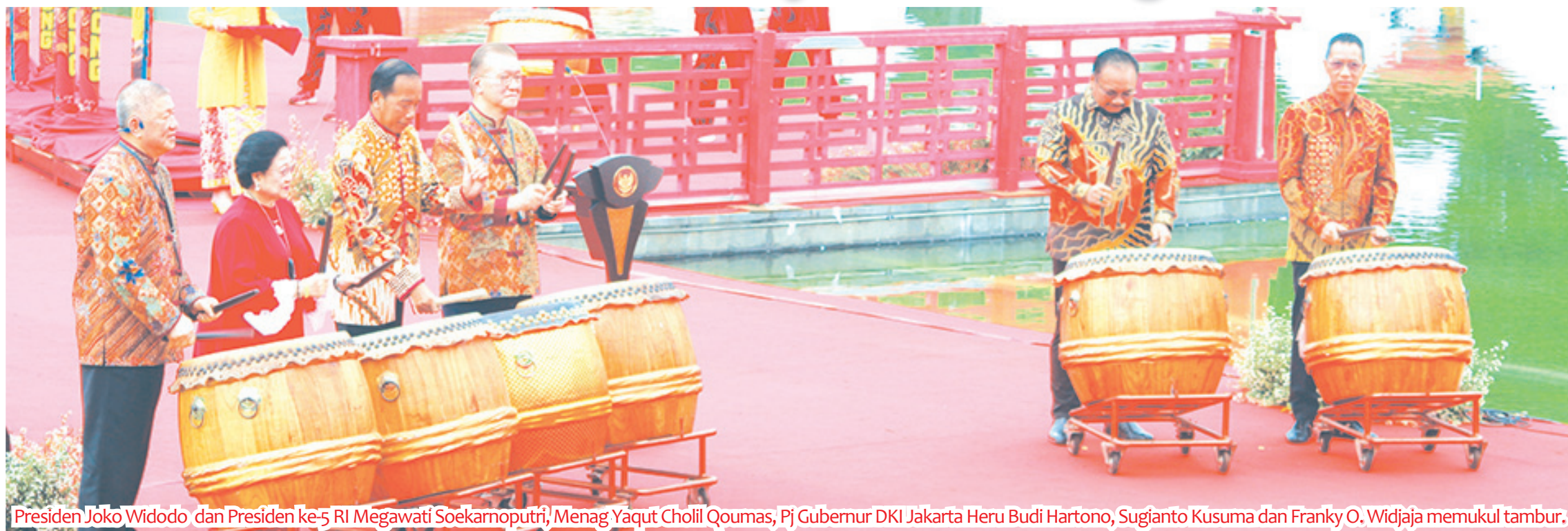
Presiden Joko Widodo dan Presiden ke-5 RI Megawati Soekarnoputri, Menag Yaqut Cholil Qoumas, Pj Gubernur DKI Jakarta Heru Budi Hartono, Sugianto Kusuma dan Franky O. Widjaja memukul tambur.