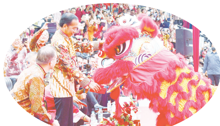
Presiden Joko Widodo memberikan angpau kepada barongsai.