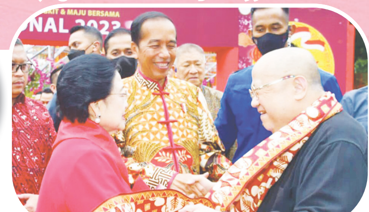
Pendiri MURI Jaya Suprana menyapa Megawati Soekarnoputri dan Presiden Joko Widodo.

JAKARTA (IM) - Sebagai wujud berbagi kebahagiaan dalam perayaan tahun baru Imlek, yang jatuh pada 22 Januari 2023 lalu, organisasi masyarakat Tionghoa dari Yayasan Tzu Chi Indonesia, PSMTI (Paguyuban Sosial Marga Tionghoa Indonesia), Perhimpunan INTI (Indonesia Tionghoa), PTKI, Permadubdi dan PITI (Persatuan Islam Tionghoa Indonesia) berkolaborasi dengan Pemprov DKI Jakarta menyelenggarakan peringatan Imlek Nasional 2023 bertajuk "Bersyukur, Bangkit dan Maju Bersama".